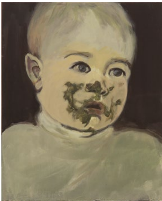
Claire Tabouret, Les Mangeurs 3 , 2013, acrylique sur toile. Collection FRAC Auvergne

L'exposition Le Toucher du monde , conçue en collaboration entre le musée municipal Paul-Dini et le FRAC Auvergne, fonds régional d'art contemporain, réunit pour la première fois une soixantaine d'œuvres des deux institutions, dans un dialogue inédit jouant sur les résonances successives d'œuvres et d'artistes qui, pour certains, sont présents dans les deux collections.