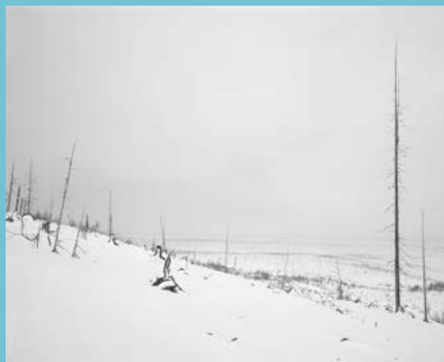
Darren Almond, Night+Fog (Norilsk) (19) , 2007, bromide print. Collection FRAC Auvergne © collection Frac Auvergne