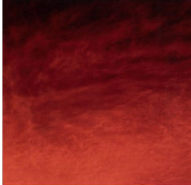
NASA, Cloud over Mars , 1997, épreuve numérique. Dépôt du Cnap au FRAC Auvergne en 2022 © collection Frac Auvergne / photo Y. Cheno.

Venez vous initier, avec notre médiatrice, à une séance d'atelier d'écriture: laissez-vous inspirer par les œuvres et à vos stylos! Durée: 1h30. Tarif: 7€ / personne Limité à 10 participants. Réservation au musée.