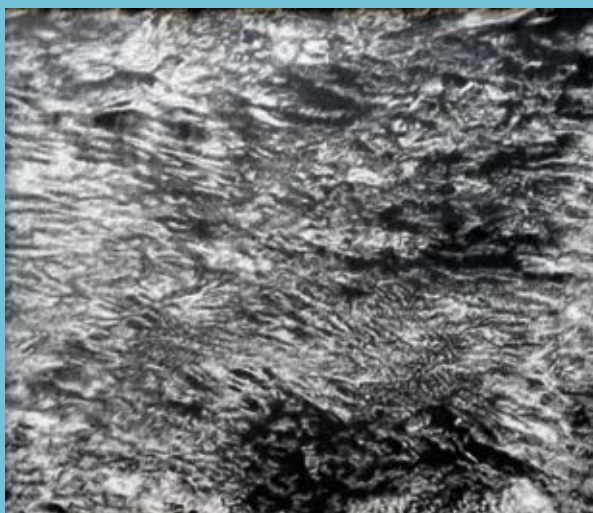
Éric Manigaud, Eau #1 , 2004, mine de plomb et poudre de graphite sur papier. Collection FRAC Auvergne © Adapp, Paris, 2023 © collection Frac Auvergne