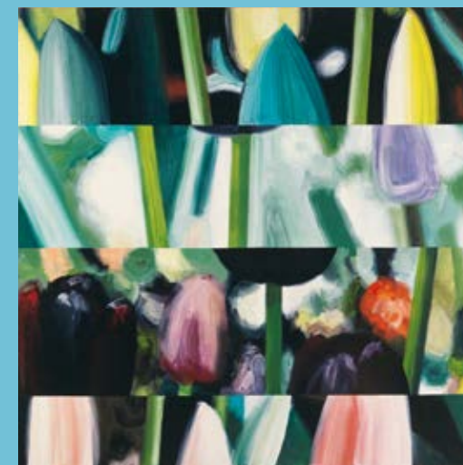
Carole Benzaken, Dream boat , 1995, acrylique sur toile. Collection musée municipal Paul-Dini de Villefranche-sur-Saône © Adapp, Paris, 2023 © musée Paul-Dini / photo D. Michalet.