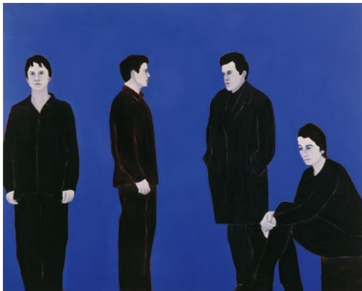
Djamel Tatah, Sans titre, n° 98015 , 1998, huile et cire sur toile. Collection musée municipal Paul-Dini de Villefranche-sur-Saône © Adagp, Paris, 2023