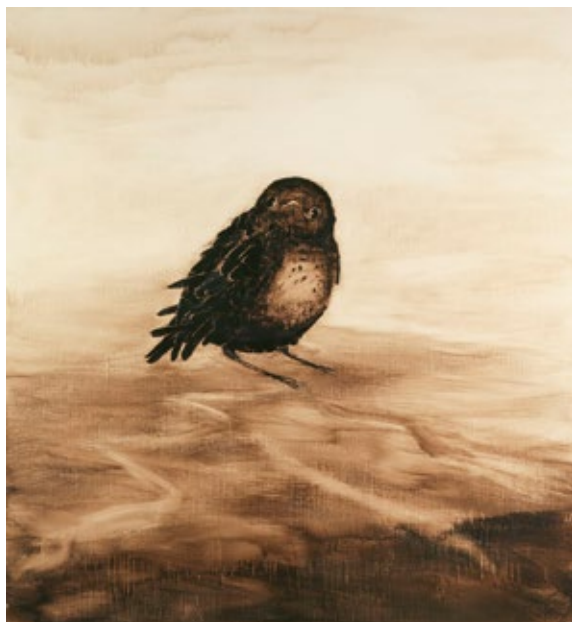
Ernst Kapatz, Oiseau 763 , 1996, autocoating et laque sur toile marouflée sur bois. Collection musée municipal Paul-Dini de Villefranche-sur-Saône © musée Paul-Dini / photo D. Michalet.

Les Théâtres des Singuliers. En marge des courants de l'histoire de l'art, ces artistes, rassemblés sous l'appellation « Singuliers », revendiquent une insolite liberté et utilisent souvent des matériaux détournés.