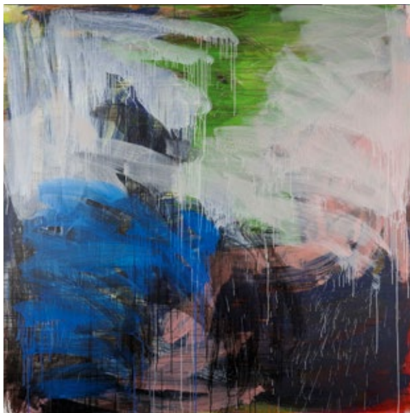
Franck Chalendar, À peu près n° 9 , 2007, acrylique sur toile. Collection musée municipal Paul-Dini de Villefranche-sur-Saône © musée Paul-Dini / photo D. Michalet.